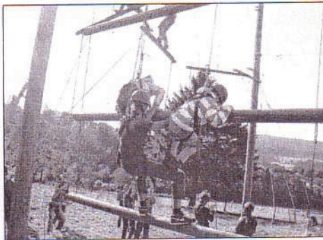
Beim Berufsorientierungscamp der Roman-Herzog-Schule stand auch der Klettergarten auf dem Programm.

verbundenen Augen, ließ die Jugendlichen erkennen, dass man mit Ruhe und Gelassenheit Vertrauen aufbauen kann. Im Klettergarten kam es weniger auf die Klettertechnik an, als vielmehr auf die Überwindung der eigenen Ängste und auf die verantwortungsvolle Sicherung der Kletterpartner.